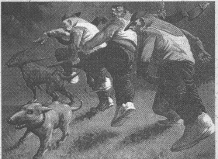
Peter Howson: Hazafiak

Ezt a primitivizmust mutatja be hatalmas művészi erővel Peter Howson Hazafiak