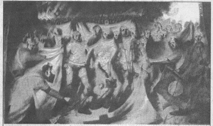
Ken Currie: Fürdőzők (részlet)

Az egyik Ken Currie műve a Fürdőzők . A kép egy álmot megfestése, s a boszniai háború idején készült. Keresztények kísérnek fürdőbe embereket. Féregtelenítés. A jobb oldalon a fürdő, mely kísértetiesen em-